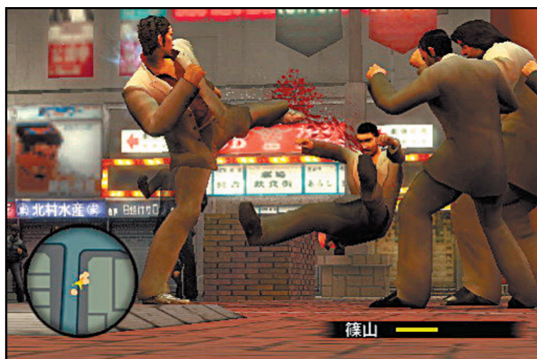
Un yakuza met les pieds où il veut et c'est souvent dans la queue.

«Yakuza» Sega revient sur le devant de la scène avec une superproduction ambitieuse