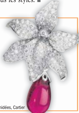
Collection Caresse d'orchidées, Cartier