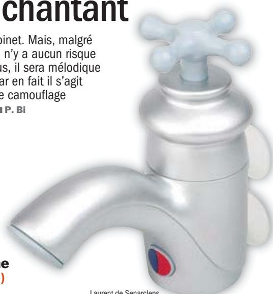
Laurent de Senarclens

16 Le nombre de pièces de la collection Diorette, ornées de fleurs, coccinelles, abeilles et papillons très colorés